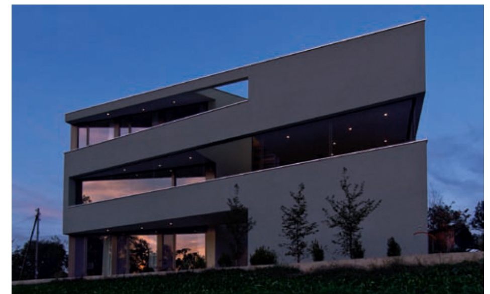
Haus Bucher in Knonau: Die erste Vorstellung der Bauherrschaft war ein Haus im «Zuckerbäckerstil». Im gemeinsamen Prozess zwischen Bauherr und Architekt entwickelte sich eine zeitgemässe Architektursprache.