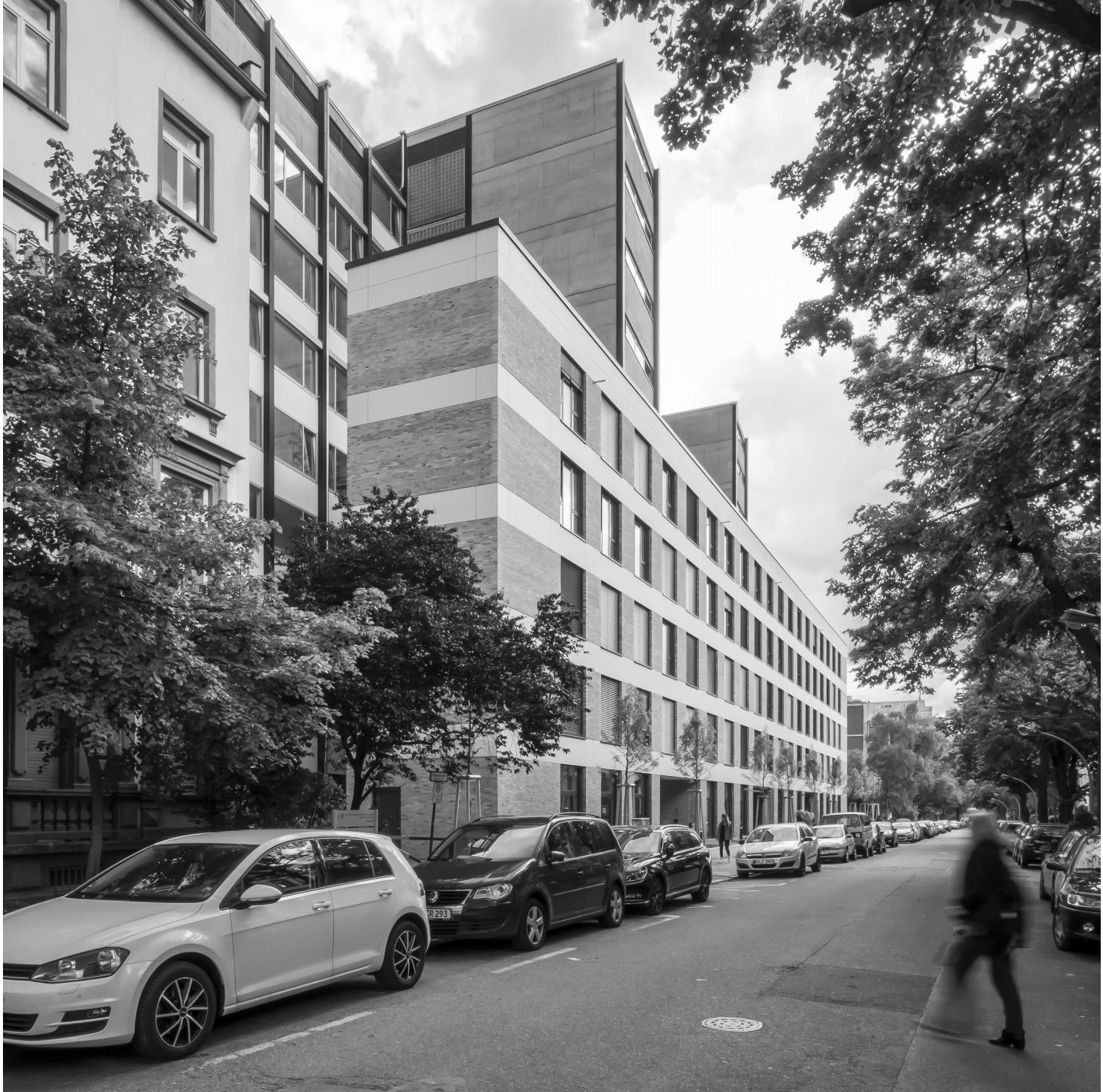
Abb. 5: Blick in die Gräfstraße nach Süden, der Altbau bleibt hinter dem Neubau sichtbar.