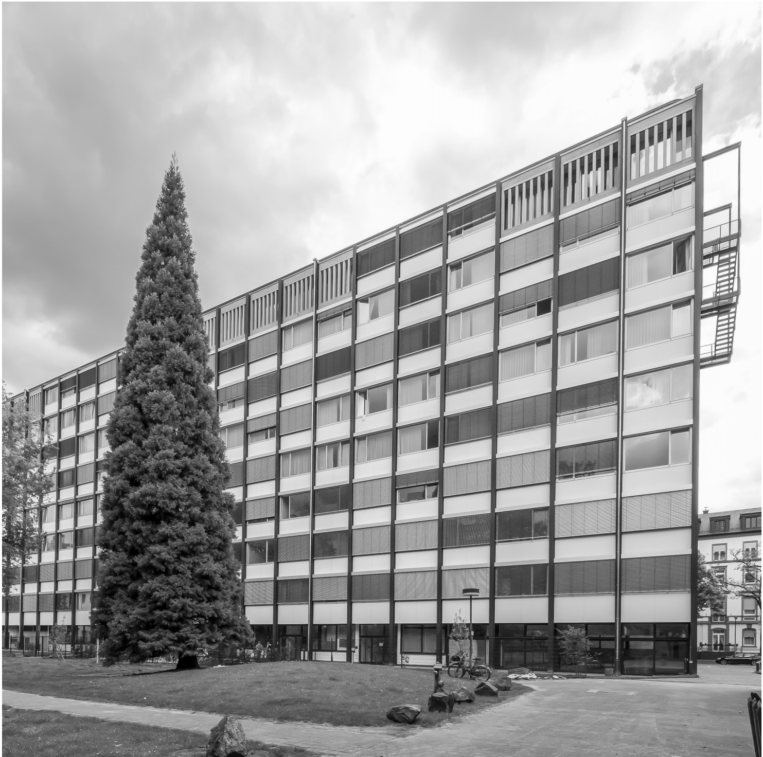
Abb. 6: Ansicht der Parkseite, die einst zum Universitäts-Campus Bockenheim orientiert war.