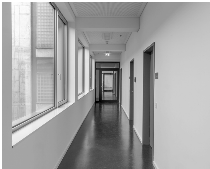
Abb. 4: Blick in den zum Innenhof orientierten Flur des Altbaus.

Ungeachtet seiner architekturhistorischen Bedeutung als eines der Hauptwerke von Ferdinand Kramer stand das Philosophicum zeit seines Bestehens immer wieder im Fokus kontroverser Debatten. Gegenstand der Kritik war zum einen die isolierte städtebauliche Situation: Das Gebäude kehrt der Straße gewissermaßen den Rücken zu und wurde von der Bevölkerung als abweisend beschrieben. Zum anderen bemängelten die Nutzer die energetischen Defizite der dünnen Außenhaut, die im Sommer zur Überhitzung und im Winter zur Unterkühlung neigte. Mehrere Gutachten belegten die Schwierigkeit einer Umnutzung angesichts der strukturellen Rahmenbedingungen – ein Abriss konnte letztlich nur durch die Intervention des Denkmalschutzes verhindert werden.