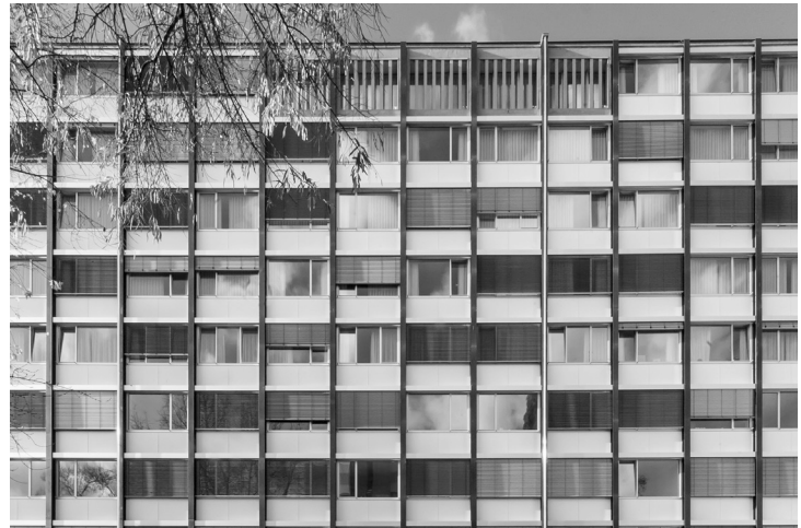
Abb. 2: Die denkmalgerecht wiederhergestellte Fassade auf der Parkseite.

Auf dieser Ebene der Gebäudeorganisation gilt die Lösung Form follows function in einem basalen Sinn: Andere Erschließungs- und Grundrissformen wären schlichtweg unökonomisch. Diese rein funktionalen Aspekte verhalten sich jedoch neutral gegenüber der architektonischen oder auch städtebaulichen Qualität von Gebäuden. Hierfür sind andere Fragen entscheidend: Wie tritt das Gebäude in einen Dialog mit dem Kontext? Wie und mit welchen Mitteln gestaltet seine Fassade den öffentlichen Raum? Durch welche Gestaltungselemente entsteht eine Anmutung von Großzügigkeit oder gar Eleganz?