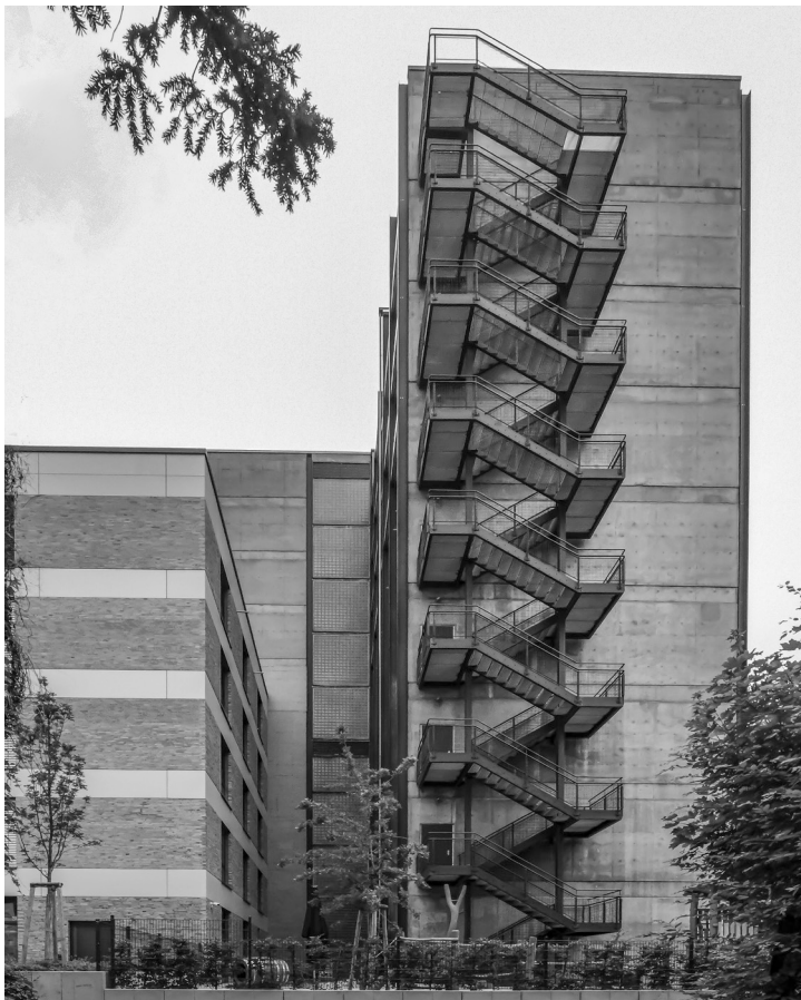
Abb. 1: Ansicht Philosophicum von Süden, im Bild rechts ist der Altbau.

Die Frage nach der Bedeutung der Funktion für die Architektur beschäftigt die Theorie seit Vitruv. Mein Zugang zur Funktion ist vergleichsweise einfach und eher aus der Praxis abgeleitet: Die Funktion ist zunächst nichts anderes als die Existenzberechtigung eines Gebäudes. Sie ist die notwendige Voraussetzung für eine wie auch immer geartete Bautätigkeit. Erst in einem zweiten Schritt stellt sich die Frage nach dem „Wie“ der Funktion, also nach der konkreten Ausgestaltung einer bestimmten – funktional definierten – Bauaufgabe. Aus meiner Sicht ist die architektonische Ausdrucksweise jedoch unabhängig von der funktionalen Bestimmung des Bauwerks. Man denke etwa an ein Hotel oder an ein Krankenhaus: Die Größe und Dimension der Zimmer folgen – mal mehr, mal weniger stark – den Regeln der Bauentwurfslehre und den entsprechenden DIN-Normen. Das Ergebnis ist eine Abfolge von immer gleichen Zimmern, die über einen Mittelflur erschlossen werden.